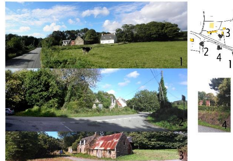
Photo de l'emplacement de l'extension. Si le projet est visible de la rue, prendre une vue la plus large possible. Vous pouvez fournir autant de vues que vous souhaitez.